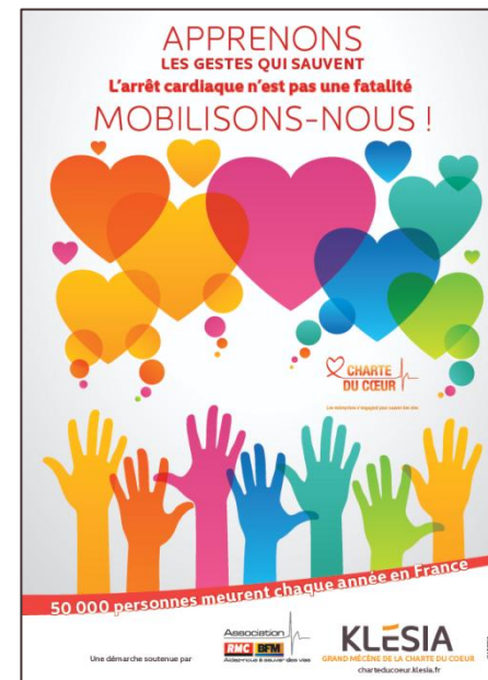
Affiche standard ou personnalisable