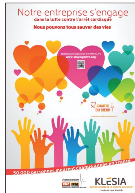
Affiche standard ou personnalisable