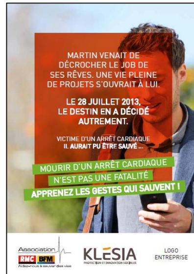
3 rectos standards ou personnalisables