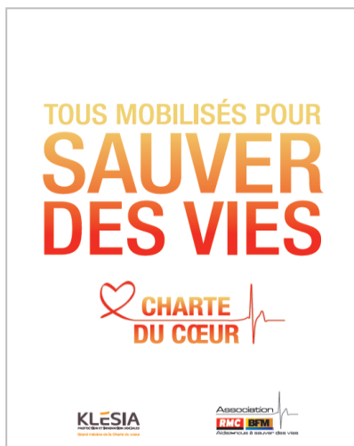
Format A5 - dépliant 4 pages. Disponible sous format PDF

▶ Dépliant « Tous mobilisés pour sauver une vie »